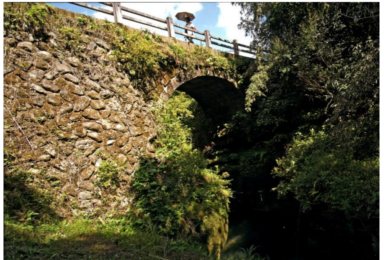
写真の部最優秀賞 「116年を経た尾崎橋」原 浩高さん